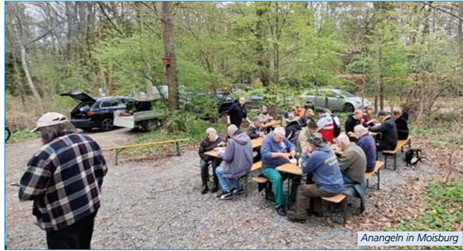
Anangeln in Moisburg