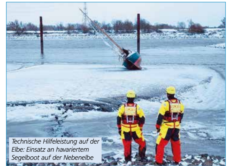
Technische Hilfeleistung auf der Elbe: Einsatz an havariertem Segelboot auf der Nebel Elbe

Neben der Ausbildung zeigt sich auch im Einsatzdienst, wie vielseitig unsere Arbeit ist. Allein im ersten Quartal dieses Jahres