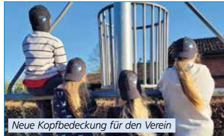
Neue Kopfbedeckung für den Verein

Wer uns schon einmal bei einem Umzug durch die Samtgemeinde begleitet hat, kennt unsere schwarzen Hüte – die sogenannten Shakos – bereits. So schön sie sind, so luftdicht sind sie auch. Im Sommer bildet sich darunter leider etwas Stauwärme. Damit wir auch bei Sonnenschein einheitlich und gut geschützt musizieren können, haben wir nun Caps mit unserem Spielmannszug-Logo angeschafft. Unsere Jugend trägt sie mit Stolz, also scheinen sie gut anzukommen.