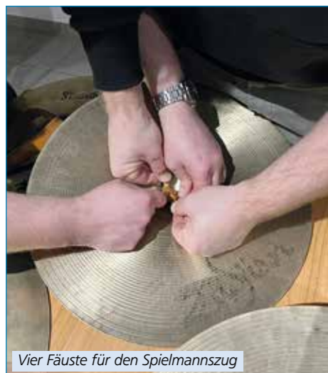
Vier Fäuste für den Spielmannszug

Mittlerweile haben wir ein großes Repertoire an Instrumenten angesammelt. Unser Instrumentarium umfasst längst mehr als Flöten, Trommeln, Pauken, Lyra und Becken. Inzwischen gehören auch ein Schlagzeug, diverse Percussion-Instrumente und verschiedene Mallets dazu. Neben der Marschmusik können wir so unseren Konzertstücken einen besonderen Klang verleihen. Vielleicht habt ihr schon ein Konzert von uns erleben dürfen? Die nächste Gelegenheit bietet sich schon bald (s. Termine).