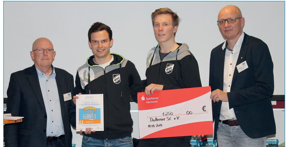
Ein Sportverein von heute, aktiv, digital und erfolgreich: Der Dollerner Sport-Club bei der Siegerehrung.

Das prämierte Konzept vom Dollerner SC fußte auf verschiedenen digitalen Tools, die dem Sportverein aus dem Landkreis Stade den zweiten Platz in seiner Kategorie bescherte. Auslöser für Digitalisierungsmaßnahmen beim Sportverein war das im Vorstand gesteckte Ziel, die Anzahl der Jugendlichen