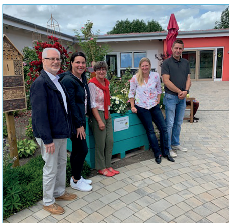
Gartenboxen im Seniorenhaus Horneburg, Otto-Balzer-Straße 6a in Horneburg.

Freiwillige, die sich gerne beim Projekt der Gartenboxen einbringen möchten und z. B. bei der Pflege helfen möchten, werden dringend gesucht! Bitte melden Sie sich im Freiwilligenzentrum.