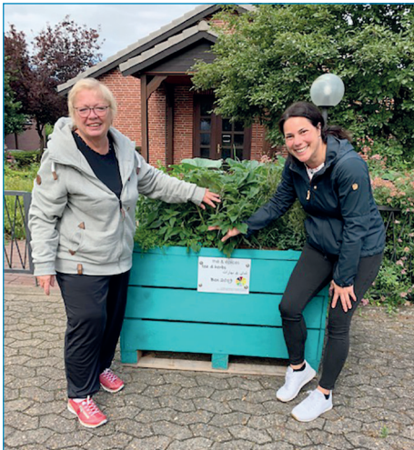
Gartenboxen für die Bedürftigen der Buxtehuder Tafelausgabe in Horneburg.

Jede Besucherin und jeder Besucher der Tafel kann von dem reichlich wuchernden Angebot der „Tee- und Kräuterboxen“ profitieren und etwas davon mit nach Hause nehmen.