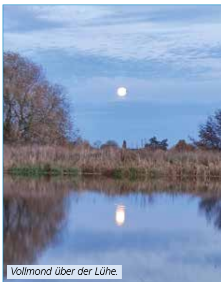
Vollmond über der Lühe.

Ausgleichzahlung in Aussicht gestellt. Das Geld würde selbstverständlich der Aue zugutekommen. Zum Beispiel zum Anlegen einer neuen Kiesschüttung als Laich- und Brutgebiet oder zum Ausbau unserer Hütte in Nottensdorf für die Brutaufzucht. Nach Klärung der rechtlichen Belange und der Zustimmung der Vorstandsmitglieder, würden wir die Anzeige zurückziehen. Was unsere Teiche anbelangt, so waren die Arbeitsdienste ziemlich schwach besucht. Daher mussten wieder diverse Arbeiten an Fremdfirmen vergeben werden. Das dafür erforderliche Geld fehlt natürlich an anderer Stelle im Verein. Jedes Mitglied sollte es sich ernsthaft überlegen, ob es die Gebühr für nicht geleisteten Arbeitsdienst sinnvoller ausgeben kann, zumal der Betrag hierfür gemäß der der letzten JHV auf 208,- €/Jahr erhöht wurde. Die neuen Arbeitsdiensttermine könnt ihr auf