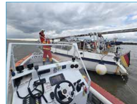
Technische Hilfe bei einer manövrierunfähigen Segelyacht auf der Elbe

Ihre DLRG Ortsgruppe Horneburg/Altes Land e. V. ■