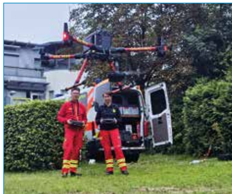
Personensuche mittels Drohne mit Wärmebildkamera in Buxtehude.

Dazu zählte unter anderem die logistische Unterstützung bei einem Großfeuer