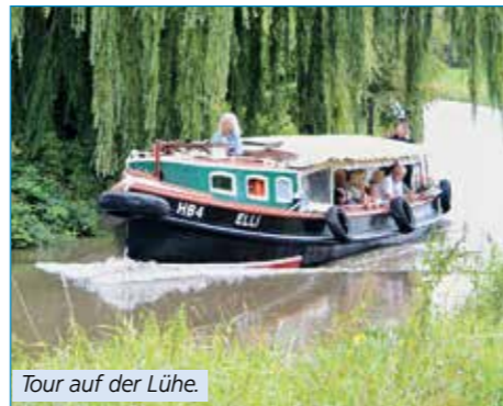
Tour auf der Lühe.

Wir würden uns freuen, viele Gäste an Bord der historischen Barkasse Elli begrüßen