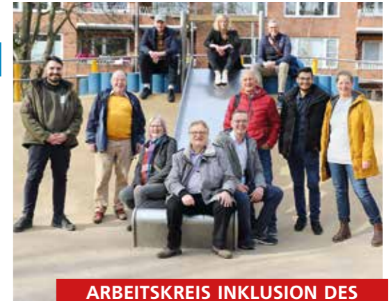
ARBEITSKREIS INKLUSION DES SAMTGEMEINDERATES HORNEBURG

Mit freundlichen Grüßen die Vertreter im Ausschuss ■